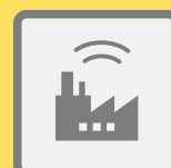
ГУДКИ ПРЕДПРИЯТИЙ И ТРАНСПОРТНЫХ СРЕДСТВ